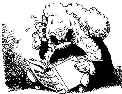
Ur SLA:s program

Det är alltid samma problem. Vänsterorganisationerna hinner inte med mer grundstudier än att introducera till organisationens egen politik. De bredare progressiva rörelserna är kanske inte så fast organiserade att de orkar dra igång marxistiska studier. Och en massa marxistisk litteratur är svår att få tag på, svår att läsa eller alltför schematisk och torftig för att fungera när man vill lägga en fast grund i sitt eget medvetande. Vad gör man då?